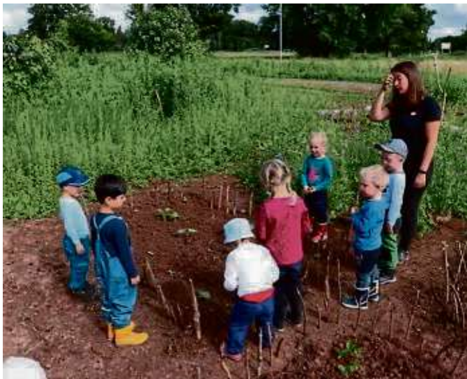
Natur-Kitas, wie hier in Erlensee im Jahr 2021, sollen durch das Konzept gestärkt werden.

„Dafür wollen wir die jungen Menschen in allen Bildungsstufen erreichen. Das Verständnis darüber, was Natur, unser direktes Lebensumfeld für uns Menschen bedeutet, sollte möglichst früh geweckt werden.