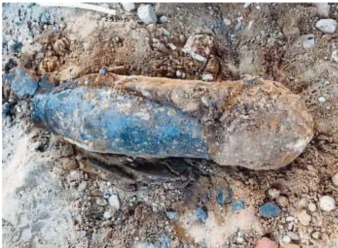
Im Oktober 2023 ist diese 250-Kilo-Weltkriegsbombe auf dem Dunlop-Gelände gefunden worden. Die Feuerwerker aus Darmstadt konnten den Blindgänger erfolgreich entschärfen.

dienste der Bundesrepublik haben eine Arbeitsgemeinschaft, tauschen sich immer wieder zu Themen wie Technik, Verfahrensweisen oder dem Sprenggesetz aus.