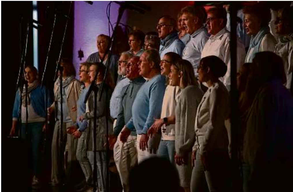
Der Chor „Just Friends Chor and more“ präsentiert sein Programm „Don't Stop The Music“ am 20. April in der Katharinenkirche in Steinau.