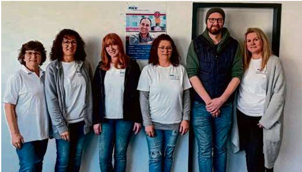
Gemeinsam unterwegs: Das medizinische Team und die Straßensozialarbeiter.

Das Spektrum reicht von der Versorgung kleiner Wunden über die Ausgabe von Salben und Verbandsmaterial bis zur Beratung zu Gesundheitsfürsorge und Impfangeboten. Das Team besteht aus Ärztinnen, medizinischen Fachangestellten und Straßensozialarbeitern. Behan-