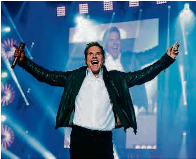
Dieter Bohlen bringt das Beste aus 40 Jahren Modern Talking mit in die Brüder-Grimm-Stadt.

Auch Helge Schneider wird wieder da sein. In diesem Jahr kommt der Unterhaltungskünstler und Kabarettist mit dem Bühnenprogramm „Katzeklo auf Räder“ ins Amphitheater. Dazu gibt es wieder Tribute Shows (unter anderem Tina Turner, ABBA, Rammstein) sowie ein Konzertabend mit der Neuen Philharmonie Frankfurt und dem Programm Symphonic Rock in Concert. Willy Astor schließt den Konzertreigen Ende September mit einem Kinderprogramm am Nachmittag („Der Zoo ist kein logischer Garten“) und dem Abendprogramm „Reimart und Lachkunde“.