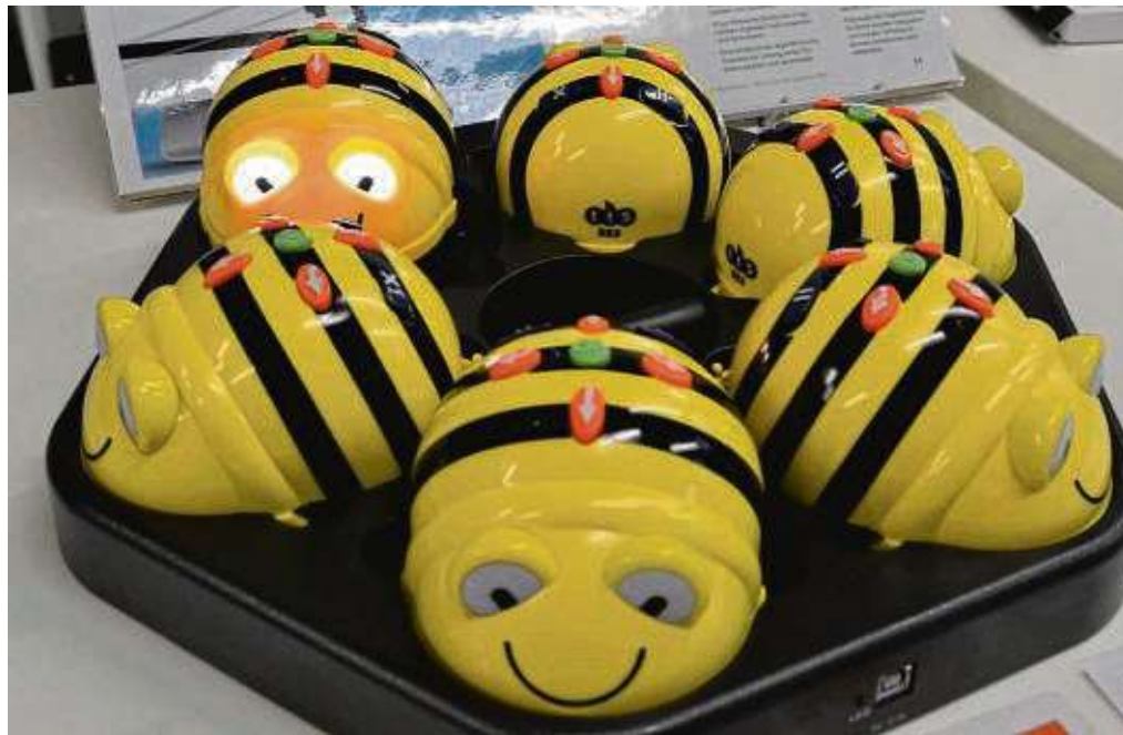
Roboter in Bienengestalt helfen bei interaktiven Arbeiten im Medien- und Technologiebereich.

Rund 370 000 Euro wurden investiert, um einen Raum für eine zeit-