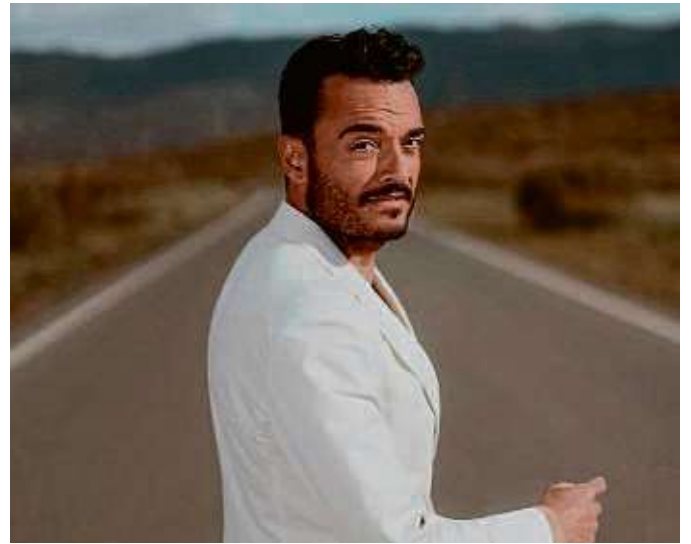
Giovanni Zarrella steht gleich zweimal in Hanau auf der Amphitheater-Bühne.